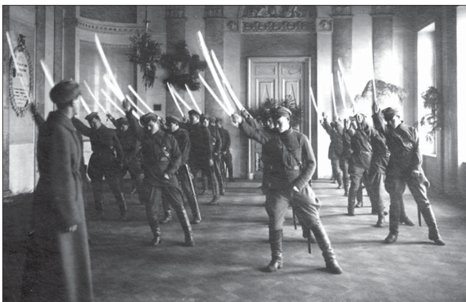
Красноармейцы-кавалеристы Отряда на шашечных занятиях.

В дальнейшем ОСНАЗ ВЧК – ОГПУ стал основой дивизии особого назначения при Коллегии ОГПУ СССР – будущей Отдельной мотострелковой дивизии особого назначения (ОМСДОН) имени Ф.Э. Дзержинского. ■